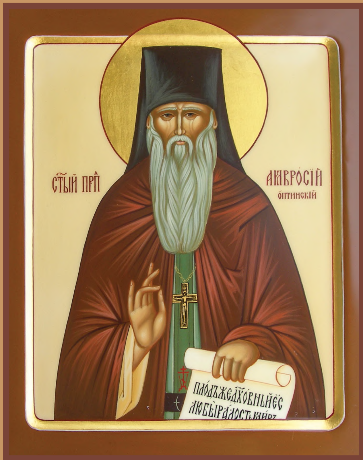
Преподобный Амвросий Оптинский. Икона, XXI век